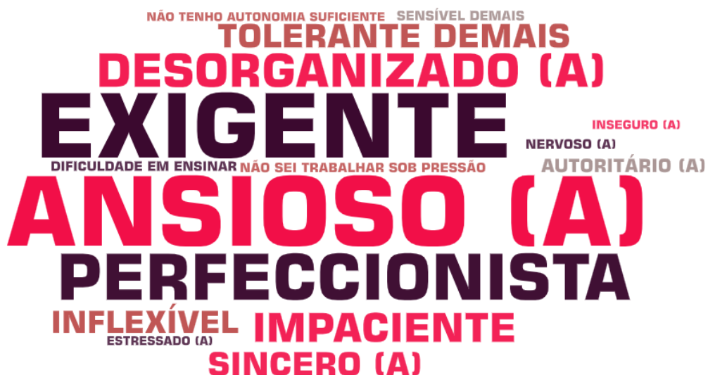
Figura 2: Principais pontos negativos ou fracos dos enfermeiros da ESF.

Os pontos positivos ou fortes mais citados pelos enfermeiros foram “dedicado (a)” (15), “companheiro (a)” (12), “organizado (a)” (12), “resolutivo (a)” (12) e “responsável” (11).